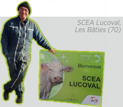
SCEA Lucoval, Les Bâties (70)

Ce partenariat, fidèle depuis 25 ans, est un atout dans la rentabilité de l'exploitation.